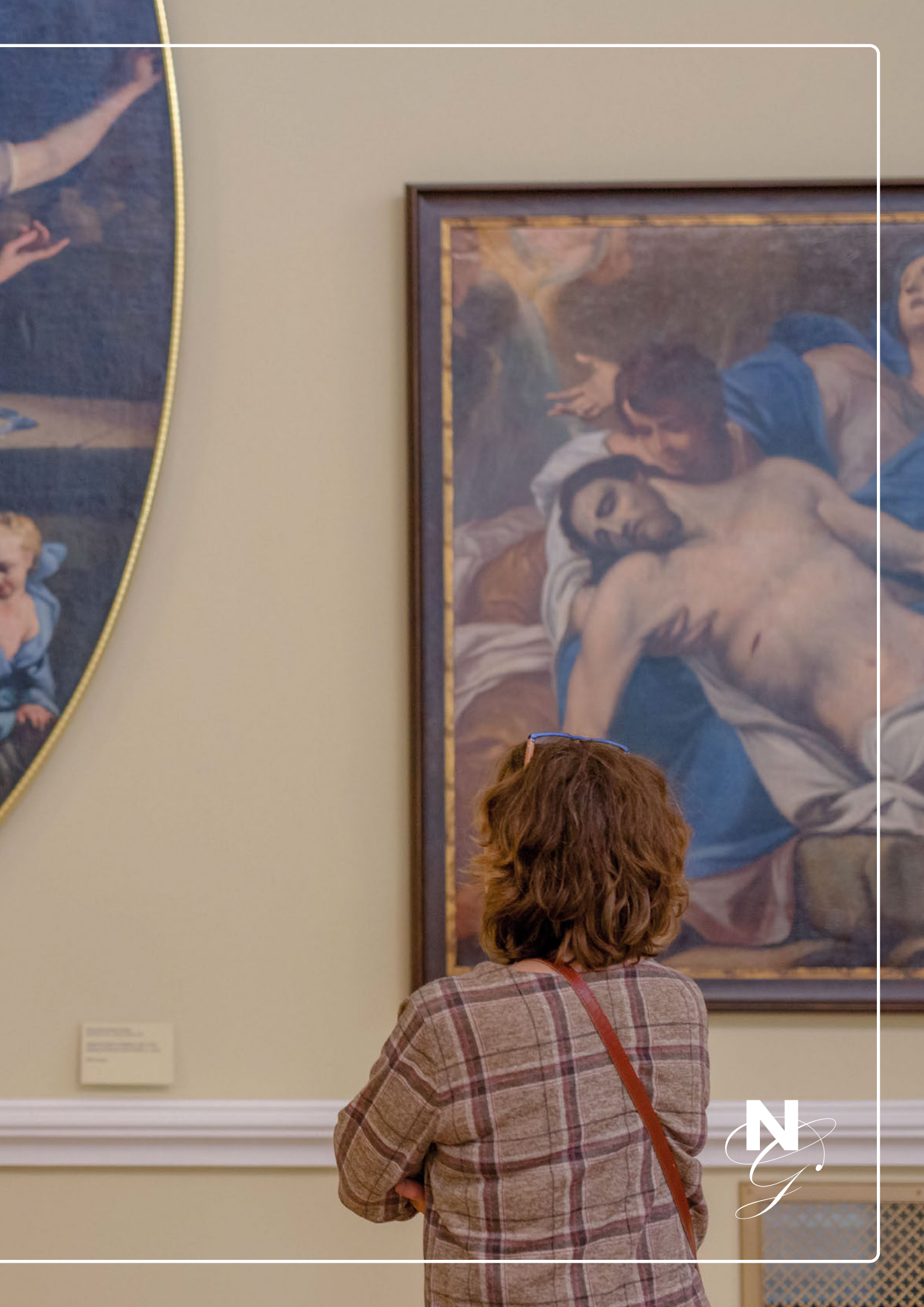
Small informational plaque on the wall.