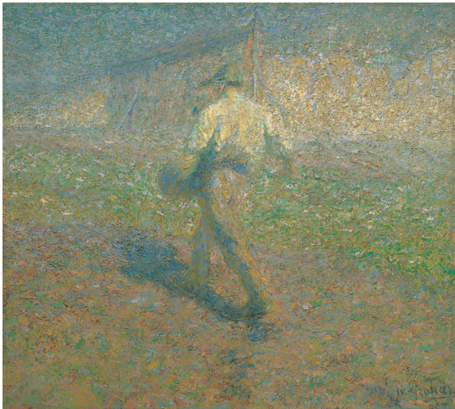
Ivan Grohar, Sejalec, 1907

Odlično je izpopolnil tehniko slikanja z lopatico. Za vsak motiv posebej je razmislil, kako bi z lopatico nanesel barvo na platno. Ko je slikal sejalca na polju, je tudi s polaganjem barve posnemal grudice zemlje in celo sejalčev gib. Slovenski impresionisti so želeli povedati, da slikajo slovensko pokrajino . Zato so v krajinah večkrat naslikali kozolce , značilno slovensko stavbarstvo za sušenje sena.