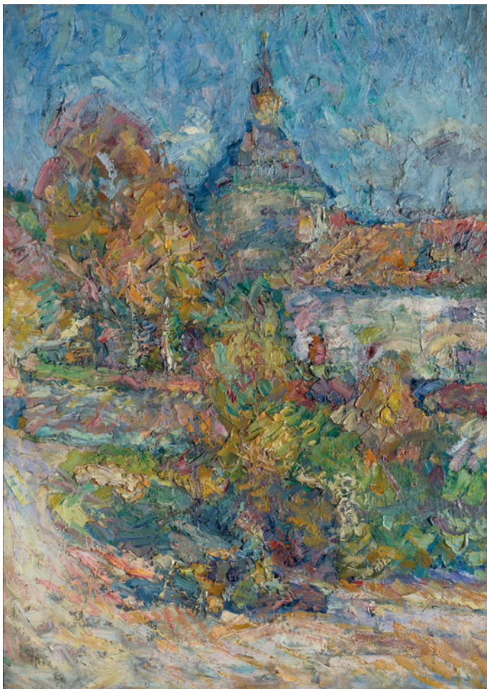
Rihard Jakopič, Križanke , 1909

Leta 1906 se je slikar z družino iz Škofje Loke preselil v Ljubljano. Stanoval je v prvem nadstropju na Emonski cesti 2. Z okna se mu je odpiral pogled na stavbo Križevniške cerkve s kupolo, obzidjem in vrtom ter z visokimi drevesi, ki so delno zastirala pogled. Znanih je več deset slik, na katerih je Jakopič zajel pogled na Križanke. Največkrat jih je slikal v zimskem soncu ali ob jutranjih in večernih zastrtih osvetljavah. Barve je nanašal z izrazito pastoznimi nanosi in silovito potezo , kar odseva tudi njegovo notranje razpoloženje .