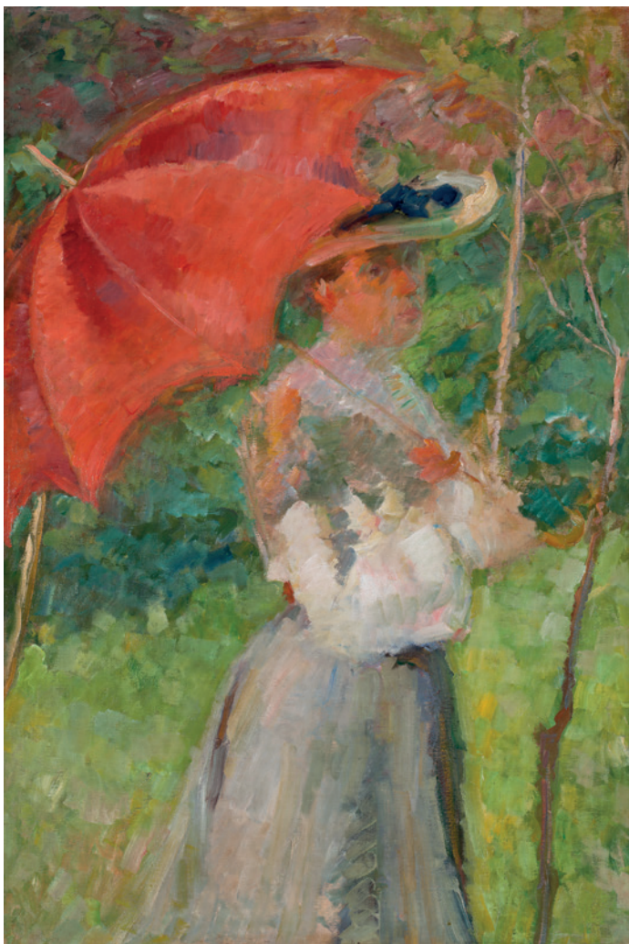
Matej Sternen, Rdeči parasol , 1904

svetlobe (ali je svetloba iz delcev ali je valovanje), dojemanje barv (zelena in rdeča sta komplementarni barvi, torej v najbolj izrazitem kontrastu), vpliv fotografije (hipnost trenutka, drzen izrez slike). Motiv ženske s senčnikom je bil sicer uveljavljen v evropskem impresionizmu.