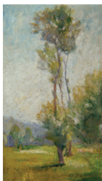
Rihard Jakopič, Jagnedi v jutranjem soncu , 1901

1. V stalni zbirki so na ogled impresionistične slike, na katerih so upodobljena drevesa. Oglej si, kakšne barve je uporabil slikar. Jih je nanašal s čopičem ali z lopatico ? So nanosi barv PASTOZNI (debeli) ali PRESOJNI (tanki)? Skušaj ugotoviti, v katerem letnem času so bila drevesa naslikana. Kakšno pa je bilo vreme ?