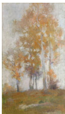
Rihard Jakopič, Breze , 1903