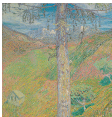
Ivan Grohar, Macesen , 1904