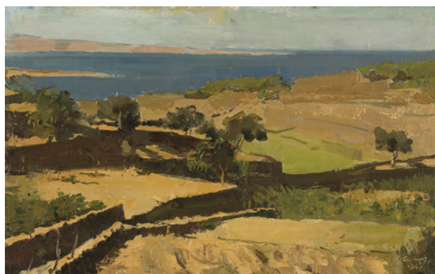
levo: Ivan Grohar, Macesen , 1904 desno: Gojmir Anton Kos, Pokrajina z Raba , 1947