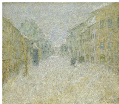
Ivan Grohar, Škofja Loka v snegu , 1905

Slikar Ivan Grohar je izpopolnil tehniko slikanja z lopatico. Za vsak motiv posebej je razmislil, kako bi z lopatico nanasel barvo na platno. Ko je slikal sejalca na polju, je tudi s polaganjem barve posnemal grudice zemlje in celo sejalčev gib. Ko je slikal macesново deblo, je z lopatico vrezoval poteze v debelo barvno plast. Ko je hotel prikazati kosme snega, je z lopatico zgladil barvne prehode in ustvaril vtis megličavosti. Poglej omenjene Groharjeve slike in razišči lopatično tehniko.