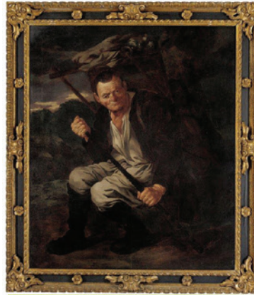
Almanach, Krošnjar , tretja četrtina 17. stoletja

Pomagaj si s slikama in poišči dva izvirna okvirja , ko boš naslednjič v galeriji. Oglej si, kaj prikazujeta sliki. Opazil boš, da se včasih okrasje okvirja povezuje z vsebino slike. Ugotovi, kako. Okrasje lahko tudi prerišes.