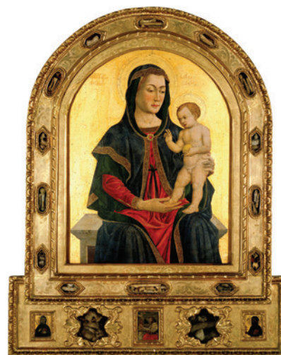
Giovanni Francesco da Rimini, Marija z blagoslavljajočim detetom ("Hoška Marija") , okrog 1465

3. Nekateri okrasni okvirji so imeli še dodatno nalogo. V galeriji imamo tudi okvir, ki je obenem hranišče za kosti svetnikov. Ljudje so ob takšnih slikah častili Marijo z Detetom in se spominjali svetnikov, ki so jim bili v pomoč. Verjeli so in še danes so prepričani, da ima slika čudodelno moč, če je v okvirju shranjena kost svetnika. Z okvirja preriši oblike odprtih za svetniške ostanke (relikvije).