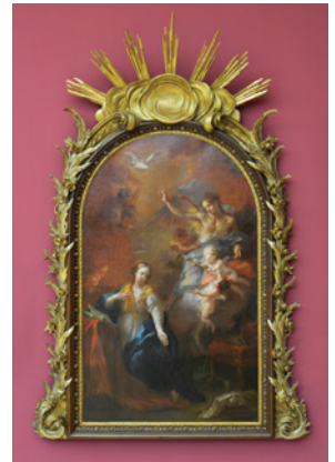
Martin Johann Schmidt, Oznanjenje , 1771

2. Oglej si sliko, ki ima dva okrasna okvirja. Eden je pravi, lesen, enega pa je naslikal slikar. Tudi na naslikanem okvirju se skriva vse polno drobnih prizorov, ki so povezani z osrednjo podobo. Zapiši ali nariši, kaj vse je upodobljeno.