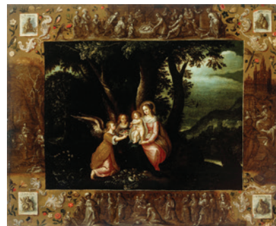
Frans Francken II., Mariji z detetom strežeta angela , okrog 1620

2. Oglej si sliko, ki ima dva okrasna okvirja. Eden je pravi, lesen, enega pa je naslikal slikar. Tudi na naslikanem okvirju se skriva vse polno drobnih prizorov, ki so povezani z osrednjo podobo. Zapiši ali nariši, kaj vse je upodobljeno.