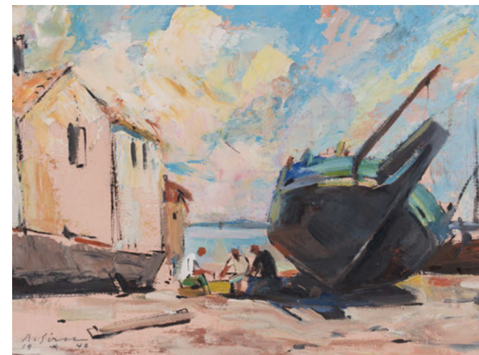
Kalafati pri malici, Caulkers at Lunch , 1940 zasebna last / private collection