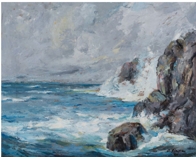
Morsko obrežje / Seashore , 1941 Narodna galerija / National Gallery of Slovenia