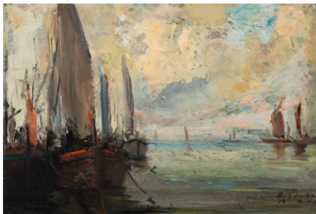
Po dežju / After the Rain , 1940 zasebna last / private collection