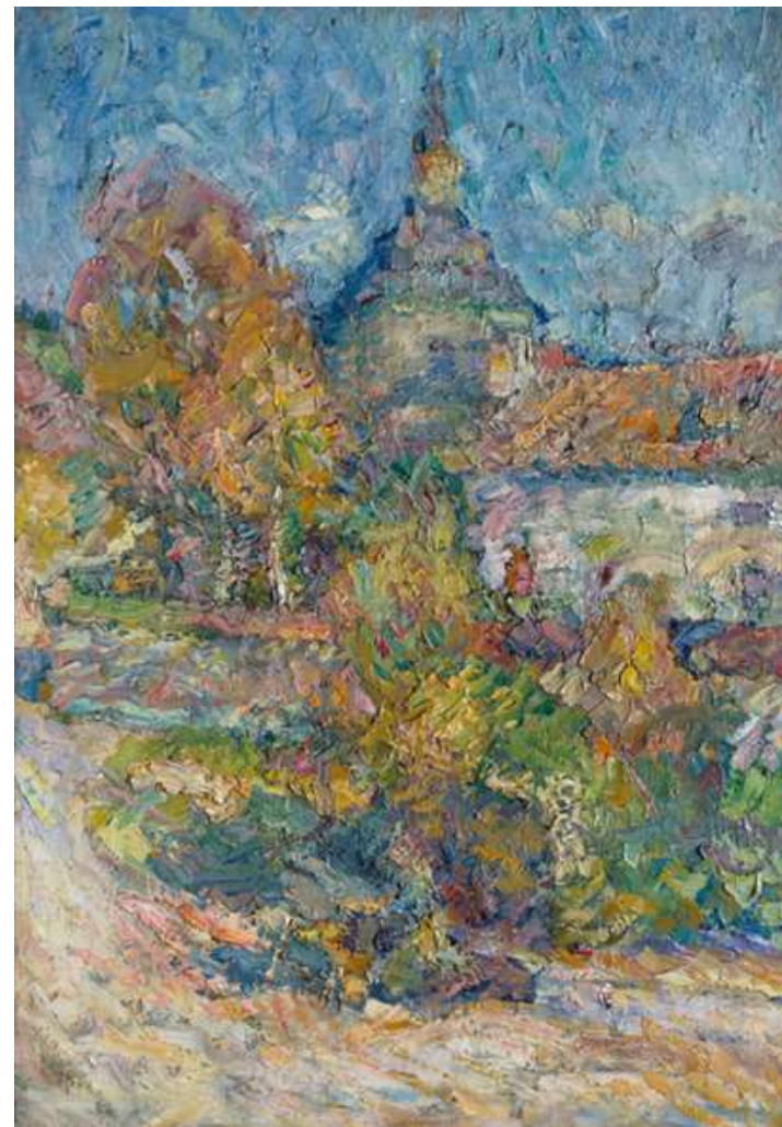
Rihard Jakopič, Križanke v jeseni , 1909