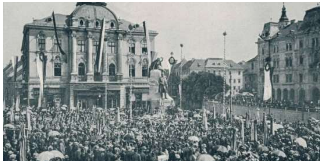
Slovesnost ob odkritju spomenika Francetu Prešernu