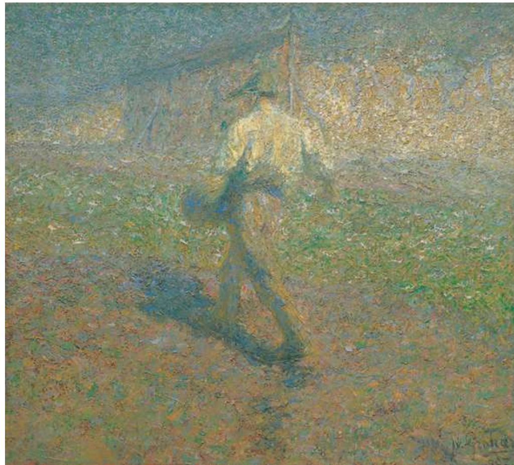
Ivan Grohar, Sejalec , 1907 Last: Moderna galerija