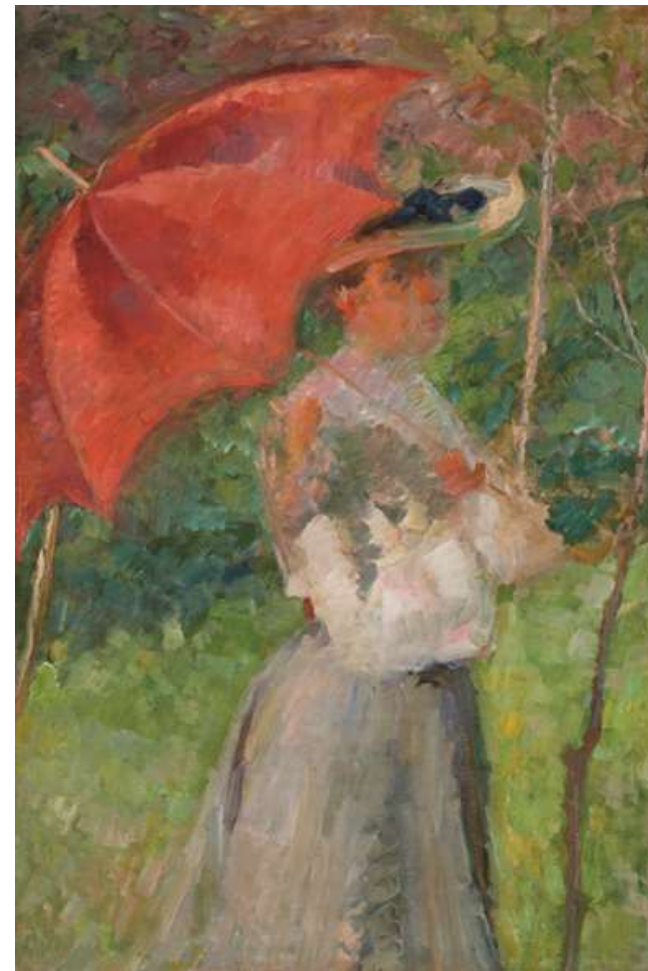
Matej Sternen, Rdeči parasol , 1904