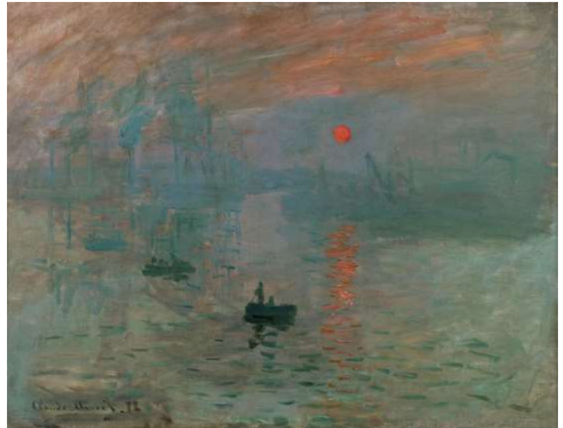
Claude Monet Impresija, vzhajajoče sonce , 1872 Musée Marmotan Monet