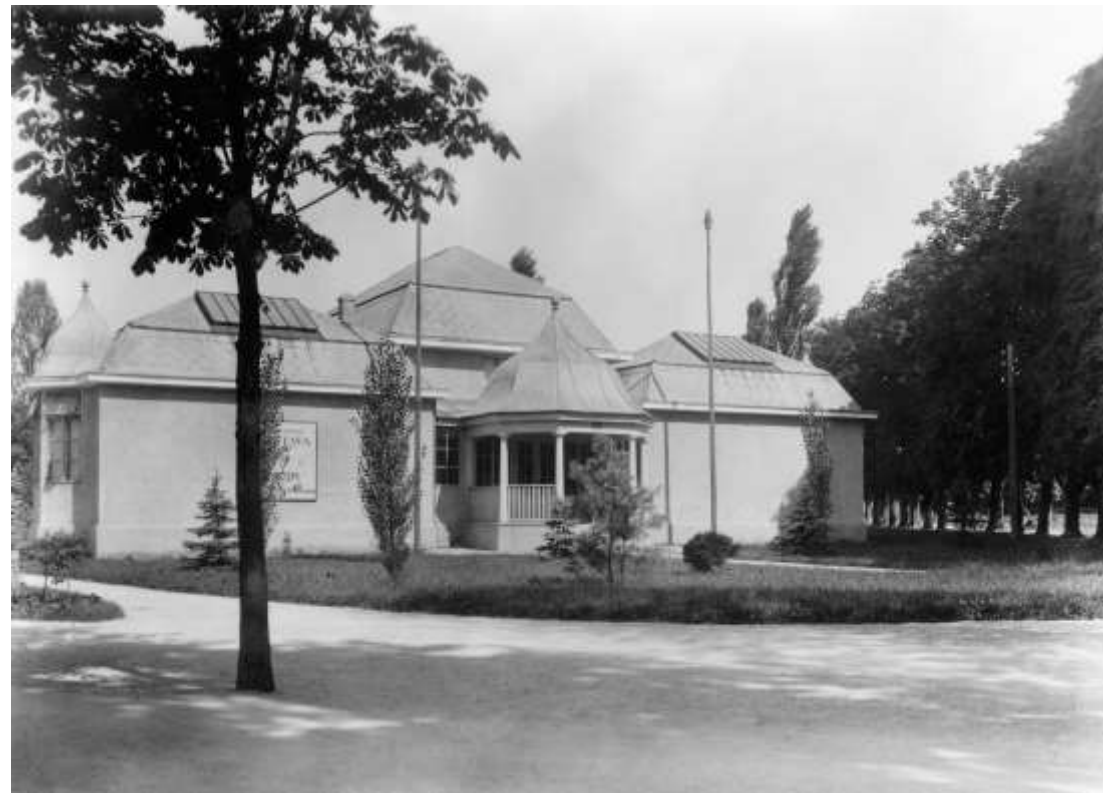
Maks Fabiani, Jakopičev paviljon, Ljubljana (danes porušeno), Zgodovinski arhiv Ljubljana