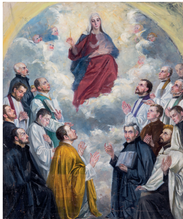
Ivana Kobilca, Marija z detetom in svetniki jezuitskega reda, študija za fresko v cerkvi sv. Cirila in Metoda, Sarajevo, (1897–1898), zasebna last

Na študiji za fresko označi soj nebeške svetlobe. Kakšna tehnika slikanja je freska?