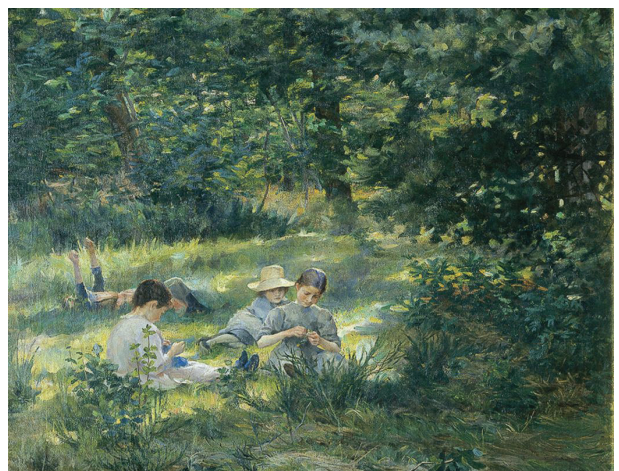
Ivana Kobilca, Otroci v travi , (1892), zasebna last

Kako še drugače imenujemo slikanje na prostem?