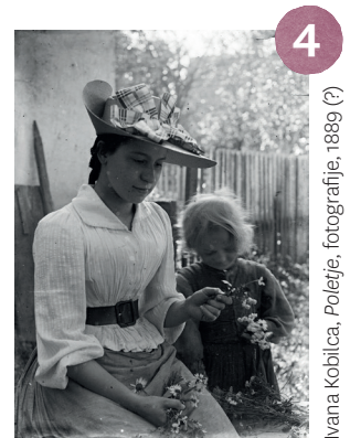
Ivana Kobilca, Poletje , fotografije, 1889 (?)