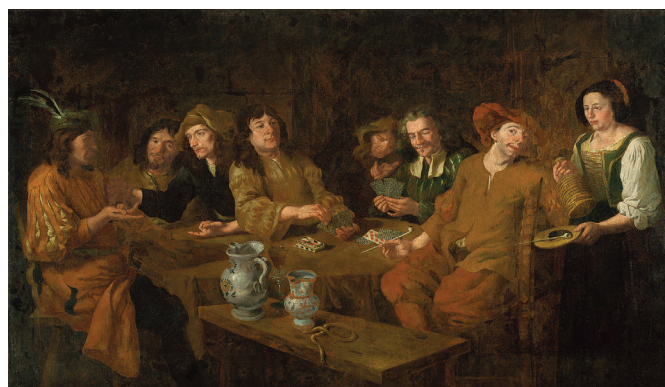
Almanach, Kvartopirci I , okrog 1660

2. Oglej si skupinski portret vesele družine, ki se imenitno zabava ob igranju kart. Med kvartopirci je slikar upodobil tudi samega sebe. Ali ga prepoznaš? Kaj drži v rokah?