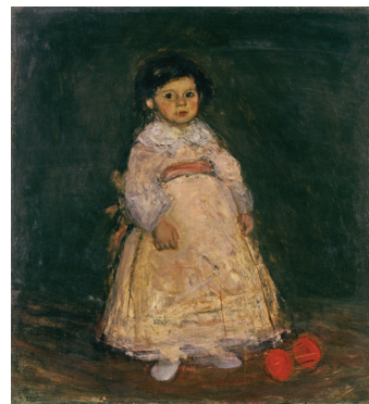
Gabrijel Stupica, Lucija v starinskem oblačilu , 1953