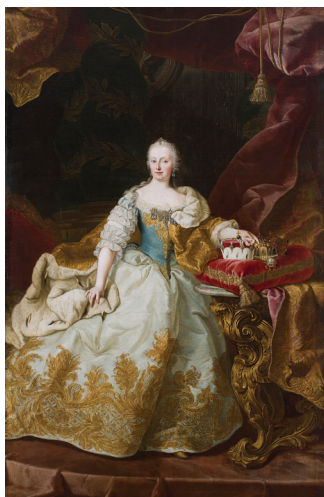
Martin van Meytens ml., Cesarica Marija Terezija , okoli 1742