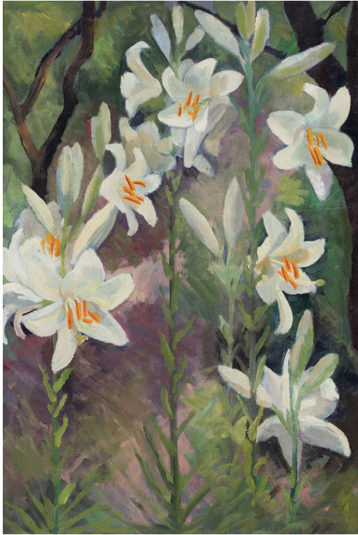
Lilije v vrtu , (1931) zasebna last