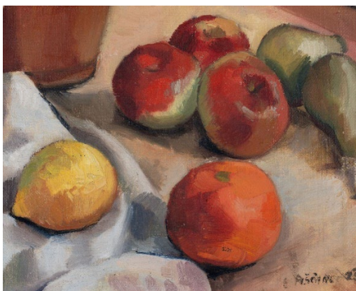
Tihožitje z jabolki, (1929) zasebna last