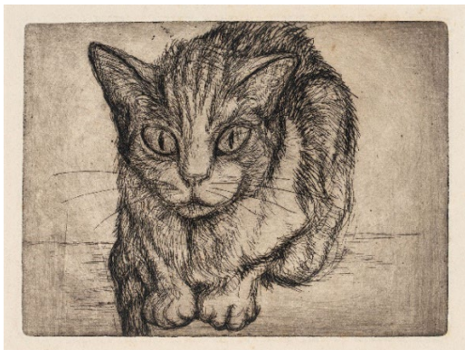
Mačka , (1928) Narodna galerija