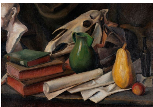
Tihožitje s konjsko lobanjo, (1928) Narodna galerija