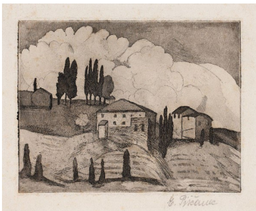
Južni motiv , (1928) Narodna galerija